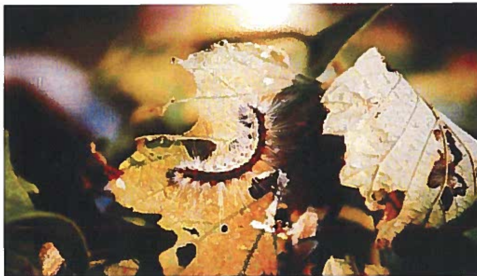
Larva di Hyphantria Cunea

Al centro - sud o nelle isole, si potrebbe anche giungere a tre generazioni l'anno.