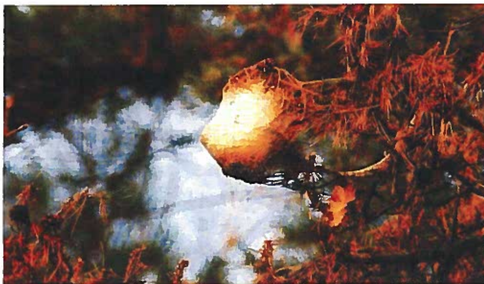
Nido di Thaumetopoea pityocampa.

In entrambi i casi lo scopo sarà quello di realizzare un ambiente sfavorevole ed inidoneo alla vita della processionaria durante il suo ciclo di sviluppo.