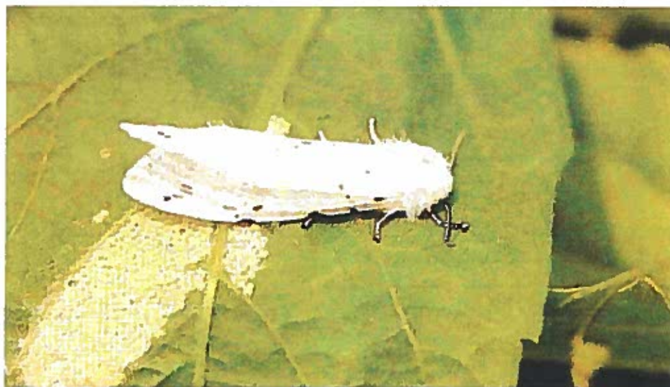
Adulto femmina di Hyphantria C. durante l'ovodeposizione.

I bruchi, raggiunta la maturità (in un mese circa) si mettono alla ricerca di adatti ricoveri: nel terreno, in un anfratto di tronco d'albero, in crepe nei muri, sotto le tegole delle abitazioni, per incrisalidarsi e svernare (larve della II generazione).