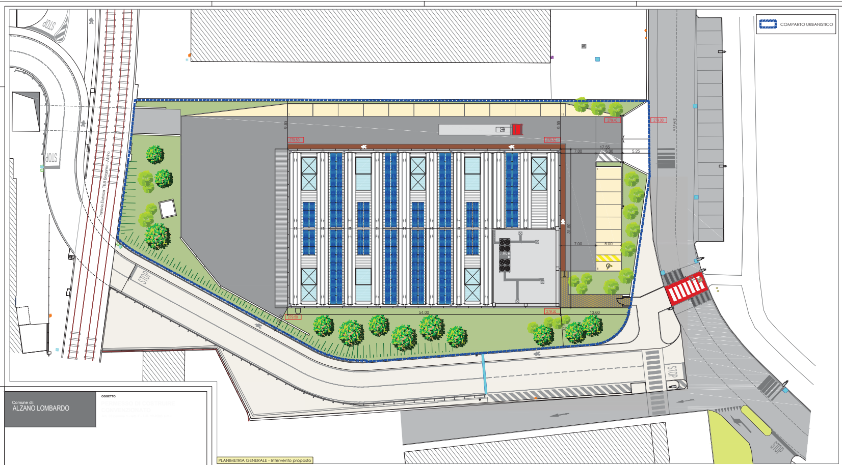
PLANIMETRIA GENERALE - Intervento proposto