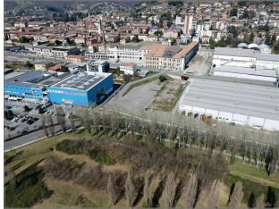
RIPRESI FOTOGRAFICHE (Stato di Fatto)