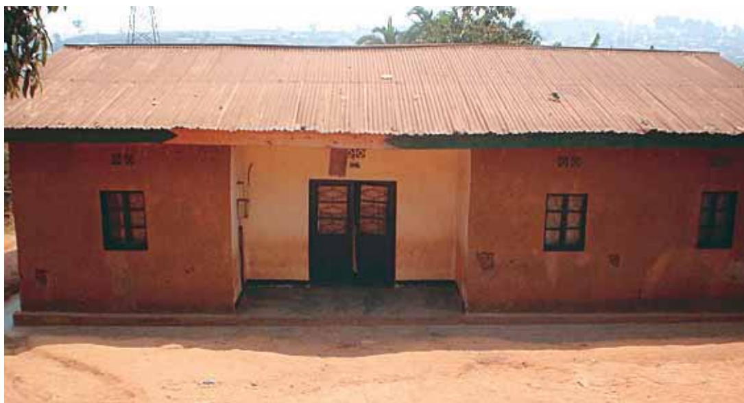
La struttura che ospita la "Gardenie" di Amizero