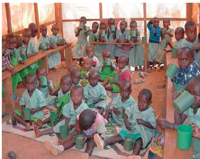
A tavola per il pranzo .....