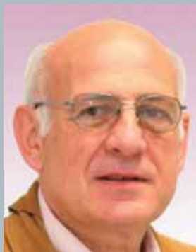
A cura dell'Assessore Giuseppe Gregis