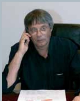
A cura dell'Assessore Giorgio Pellicoli