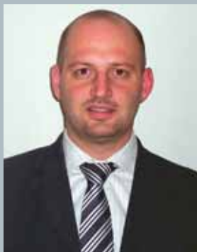
A cura dell'Assessore Camillo Bertocchi