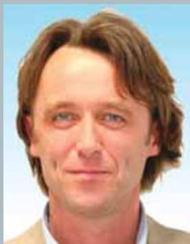
A cura dell'Assessore Pietro Ruggeri e dell'Ufficio Tecnico Settore LL.PP.