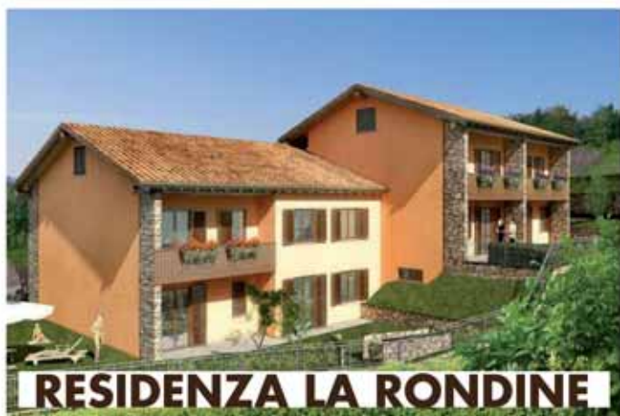
RESIDENZA LA RONDINE