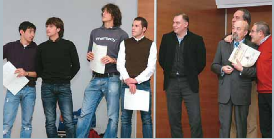
Giocatori e dirigenti ALZANOCENE 2009