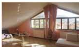
villa di serio A1428R Pedecollinare, ultimo piano, grande bilocale mansardato mq 80, terrazzi, posto auto, autonomo. Solo Euro 110.000