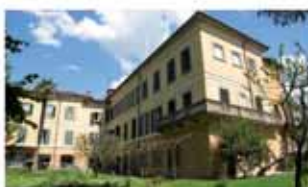
alzano I. A1559R Convento del '600, trilocale di mq 100, cantina a volte mq 30, orto. Autonomo. Euro 140.000. Box a Euro 20.000