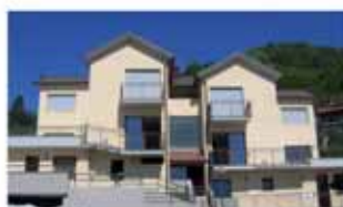
alzano I. B1567K Splendido contesto collinare, ampio bilocale mq 55 con terrazza abitabile al piano mq 40, autonomo, box. Euro 155.000