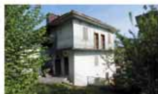
albino/fiobbio A1561R Pedecollinare, porzione di mq 140, indipendente, libera su tre lati, giardino di mq 200. Solo Euro 110.000. Introvabile