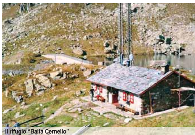
Il rifugio "Baita Cernello"