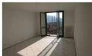
alzano I. A1440R Grandissimo bilocale di mq 78 con ascensore, terrazzo. Autonomo. Euro 139.000. Ampia possibilità box. No provvigioni