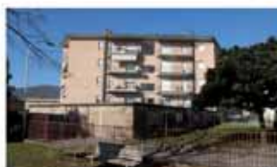
ranica A1494Q Bilocale mq 85, cucina abitabile, autonomo Euro 98.000; trilocale mq 130, cucina, terrazzi, autonomo. Euro 139.000