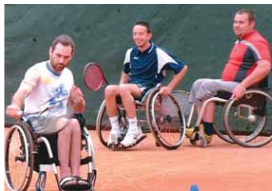
Atleti della Wheelchair alla Festa dello Sport 2006

hanno portato agli studenti un formidabile esempio positivo, non solo di sano agonismo, ma soprattutto di filosofia di vita, per capire cosa effettivamente conta. Gli argomenti trattati e le domande poste dagli studenti sono state molteplici, dalle difficoltà che in-