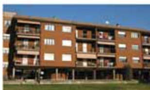
nembro A1438R Piano alto con ascensore, trilocale, cucina abitabile, doppi servizi, terrazzi, cantina, box. Autonomo. Euro 165.000