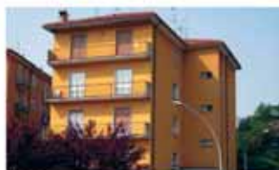
alzano I. A1260R Ultimo piano, trilocale, cucina abitabile, camino, ampi terrazzi, cantina, da riordinare internamente. Solo Euro 99.000