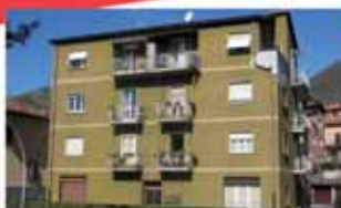
alzano I. A1537R Introvabile bilocale mq 70 con cucina abitabile, terrazzi, autonomo Euro 95.000. Box/ magazzino mq 65 Euro 50.000