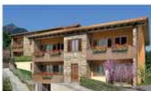
alzano I. C1488R Collinare, signorile palazzina; bilocali/trilocale/quadrilocali. Pietra e travi a vista. Scelta box, ascensore. Finiture lusso.