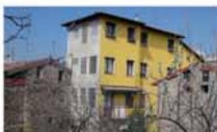
scanzorosciate A1431R Tranquillissimo bi/trilocale mq 65 in ottime condizioni, terrazzo, grande cantina, posto auto. Autonomo. Solo Euro 95.000