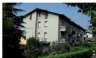
villa di serio A1578R Quadrilocale duplex, cucina abitabile, doppi servizi, cantina, box. Autonomo. Euro 215.000. Possibilità 2° box.