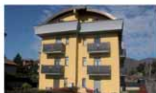
alzano I. A1321R Recente trilocale con grande giardino privato, ascensore, lavanderia, box doppio, autonomo. Solo Euro 199.000