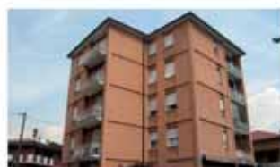
alzano I. A1573R Tranquillo trilocale mq 85 - ottime condizioni, cucina, terrazzo, cantina, autonomo. Euro 138.000. Box Euro 20.000