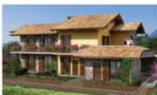
nembro/vicinanze A1534R Fantastica zona pedecollinare, signorili bilocali/trilocali, ingressi indipendenti, box doppi, giardini. Da Euro 140.000