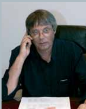
A cura dell'Assessore Giorgio Pelliccioli