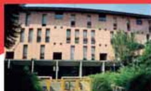
alzano I. A1068R Centralissimo; ufficio/ laboratorio mq 75 Euro 85.000; ufficio/laboratorio mq 90 Euro 85.000. Autonomi. Posti auto.