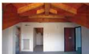
alzano I. A1080R Prestigioso attico mq 120, personalizzabile, terrazzi veramente abitabili, ascensore. Euro 299.000. Possibilità box.