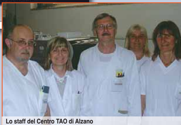
Lo staff del Centro TAO di Alzano

È stata inoltre attivata una modalità collaborativa con gli amici dell'Onco-