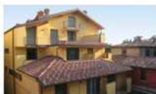
alzano I. A1438R Nuovo trilocale, piano alto, ascensore, doppi servizi, terrazzi. Autonomo. Euro 149.000. Possibilità box. No provvigioni