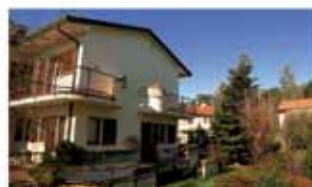
ranica A1503G Esclusiva zona residenziale, bellissima villa schiera di testa completamente indipendente, ampio giardino. Euro 400.000