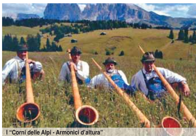
I "Corni delle Alpi - Armonici d'altura"

3. attività di Arrampicata (palestra di roccia appositamente allestita nel parco) e di ski roll (sull'adiacente pista di atletica) con attrezzature e istruttori messi a disposizione dalla locale sottosezione CAI e dallo Sci Club Speedy Sport.