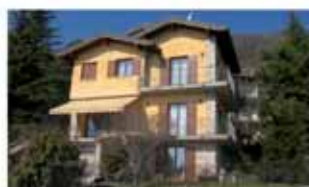
alzano I. A1532R Monte di Nese, signorile villa singola in perfette condizioni, con strepitosa vista panoramica, box triplo. Euro 480.000