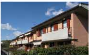
SCANZOROSCIATE rif.A1858B zona residenziale, recente trilocale in villa, primo ed ultimo piano, soggiorno, cucina, due camere, due bagni, balconi e box. € 189.000