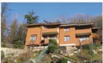
ALZANO L.DO rif.S1933P immersa nel verde con vista panoramica, villa bifamiliare mq.300, tre livelli fuori terra, ampio giardino, box quadruplo.