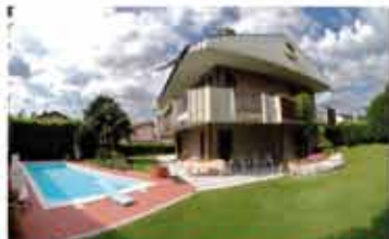
SCANZOROSCIATE rif.A1914B zona pedecollinare, villa singola di ampia metratura, giardino, piscina esterna, palestra, ascensore, box triplo. Ideale per due nuclei familiari.