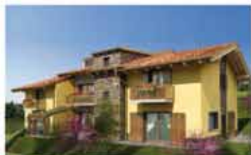
NEMBRO rif.A1987B zona collinare con vista panoramica, nuovi appartamenti e ville di testa indipendenti, giardini esclusivi, mansardo, ampi box. Classe Energ. "B"