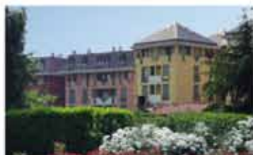
ALZANO L.DO rif.B1713K zona servita fermata T.E.B. recente trilocale piano terra con giardino esclusivo. Possibilità uso ufficio. € 145.000