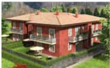
VILLA DI SERIO AIRONE zona tranquilla, signorili appartamenti varie tipologie. Piani terra con giardini. Eccellente capitolato. Classe energetica B , pannelli solari. No provvigioni