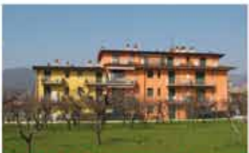
VILLA DI SERIO rif.A1616B affacciato su grande frutteto, recentissimo bilocale di 50 mq con balcone e box. Termoautonomo. Libero subito. Affare € 123.000