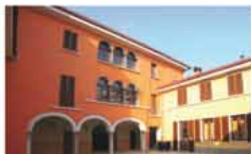
ALZANO L.DO rif.A1985B centro storico proponiamo in corte finalmente restaurata utilizzando materiali pregiati, signorili monolocali, bilocali e trilocali . Pronta consegna