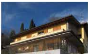
ALZANO L.DO rif.A1989B zona collinare, vista panoramica, recente villa bifamiliare , ampia metratura, portico, giardino, taverna, box doppio. Eccellenti finiture.