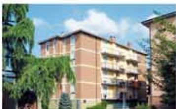
ALZANO L.DO rif.A1740B zona servita, panoramico e soleggiato quadrilocale di 106 mq ultimo piano libero su tre lati con box e cantina. Solo € 110.000