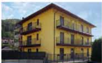
PRADALUNGA rif.A1841B piccolo contesto, nuovo trilocale in pronta consegna, soggiorno-cucina, due camere, bagno, balconi, box, posto auto. Scelta finiture. € 165.000