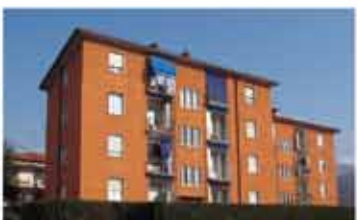
ALZANO L.DO rif.A2004B bilocale 55 mq completamente ristrutturato, soggiorno, cucinotto, camera matrimoniale, bagno, balconi, cantina. Termoautonomo € 90.000