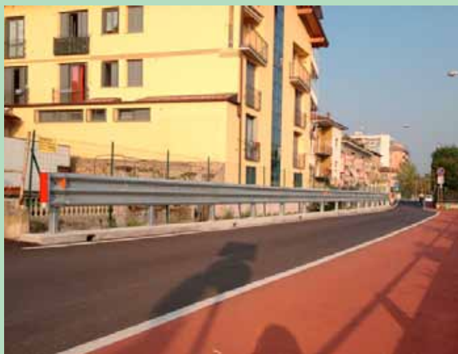
Realizzato guard rail a protezione del tratto di roggia in via Ponchielli