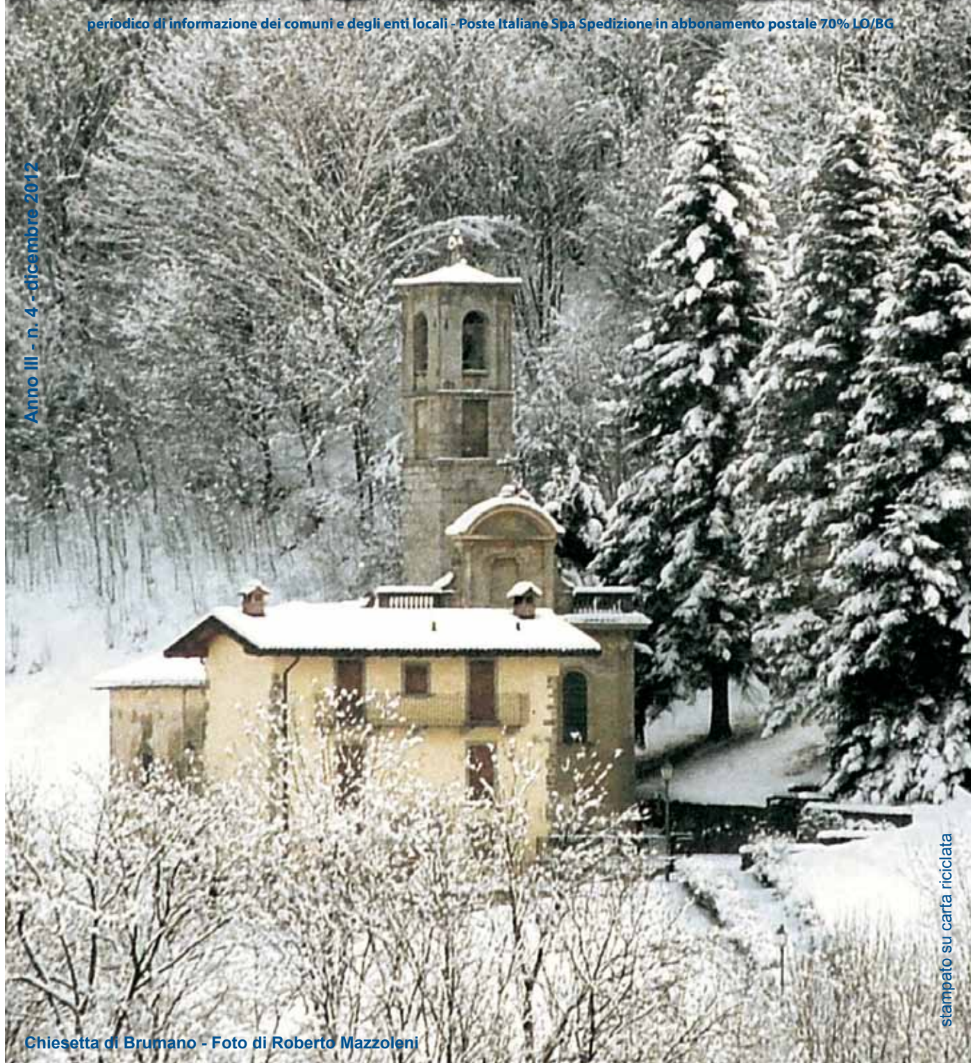
Chiesetta di Brumano - Foto di Roberto Mazzoleni