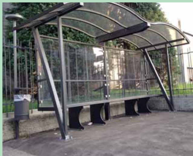
Installata pensilina alla fermata autobus presso la scuola media Giorgio Paglia di Nese