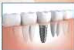
Implanto endosseo con corona prot. 1200€