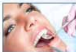
Otturazione a partire da 60€

Centro Dentistico San Marco - ALZANO LOMBARDO, via Mons. Cesare Patelli 3 Tel. 035 41 23 489 - 328 64 21 984 - Orario: da lunedì a sabato, dalle 14.30 alle 19.30 La mattina solo su appuntamento