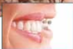
Ortodonzia mobile e fissa

▶ SCONTO DEL 10% A CHI SI PRESENTA CON UNA COPIA DI QUESTO GIORNALE