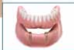
Protesi completa super. o inf. 750€