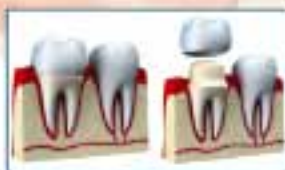
Corone in ceramica o zirconio da 450€