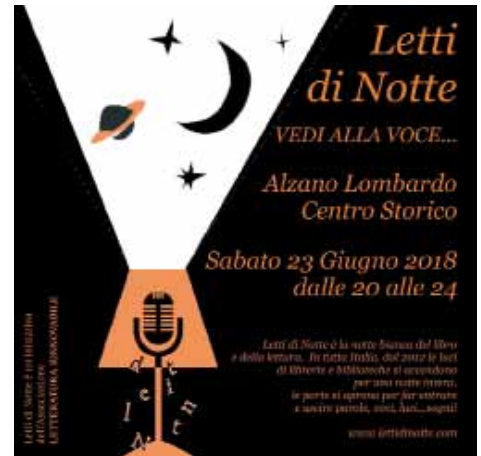
Sopra: la locandina della bella iniziativa Letti di Notte, giunta alla seconda edizione. Sotto: la visita guidata a Casa Tombini Franzi, dimora aperta per la prima volta al pubblico.

Oltre alle visite guidate sul territorio, tra cui in primis l'apertura straordinaria della bella Villa Tombini Franzi di Alzano Sopra, grazie alla collaborazione di ProLoco e Biblioteca comunale si sono volute offrire anche alcune opportunità culturali anche "fuori porta": alla scoperta delle Mura di Bergamo Alta, e visite guidate alle mostre su Cavagna e Raffaello. Alzano ha aderito per il secondo anno all'iniziativa "Sapori d'Arte", organizzata da PromoSerio, che quest'anno si è svolta in una splendida cornice primaverile, Villa e Parco Montecchio.