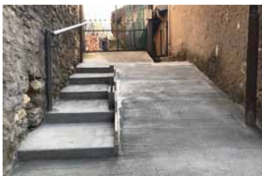
Com'era e com'è

Dopo il rifacimento del manto stradale fortemente voluto dagli abitanti a causa delle ormai vetuste condizioni del vecchio asfalto, in attesa di tempi e materiali migliori, si procede ora con la sistemazione delle scalette di collegamento tra i viottoli interni.