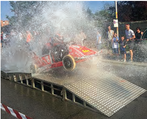
1° BOX RALLY AD ALZANO - 28 Maggio 2017