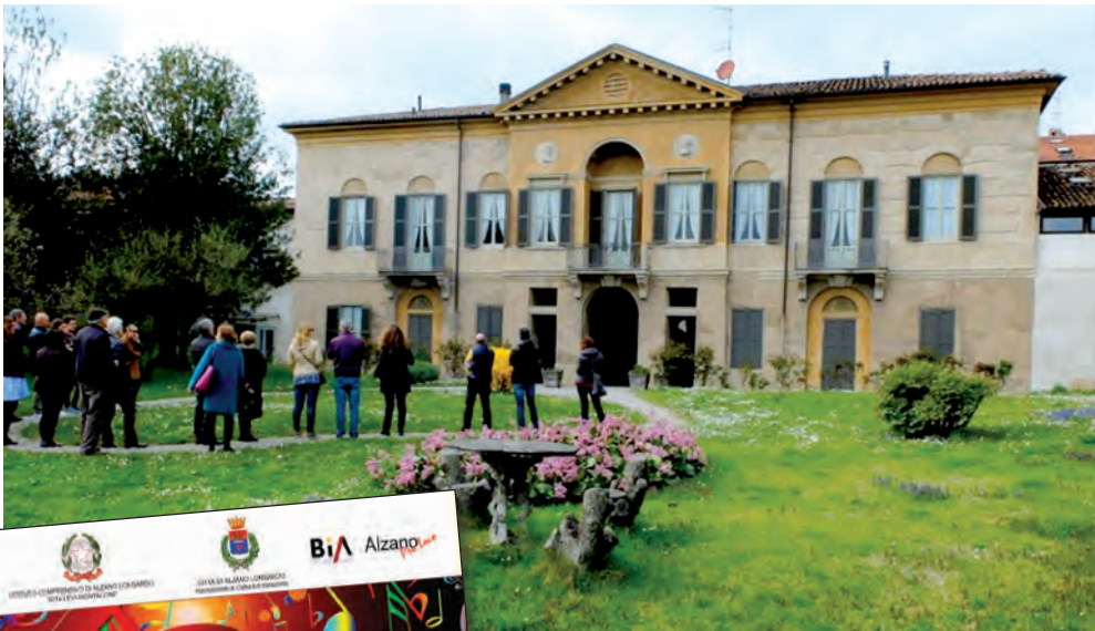
A lato: le visite guidate a Palazzo Pelandi, il 26 marzo, in una fotografia della Pro Loco