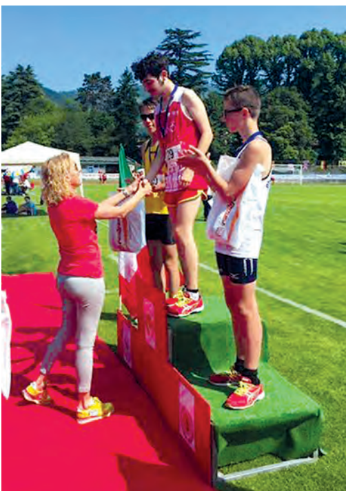
2° TROFEO ROSSO SPORTING MEETING GIOVANILE REGIONALE DI ATLETICA LEGGERA - 28 Maggio 2017