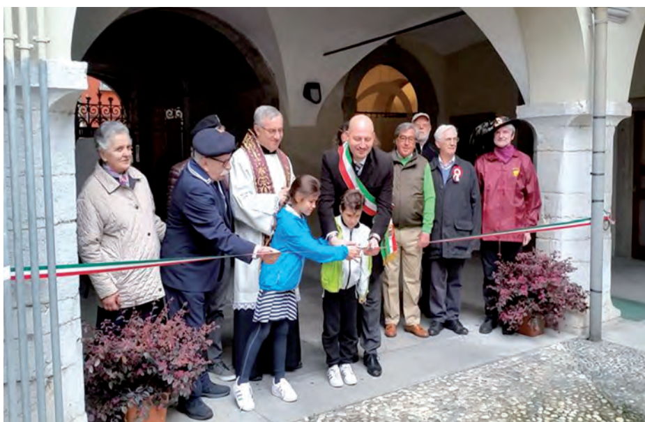
L'inaugurazione delle sale di Palazzo Pelandi il 26 marzo, alla presenza del Sindaco, del Parroco e delle rappresentanze delle associazioni d'arma e culturali con sede presso Palazzo Pelandi.

A Palazzo Pelandi è spettato quindi l'onore dell' ouverture di primavera, il 26 marzo, in un'occasione storica, primo passo di una strategia di rilancio quale polo culturale urbano. In tale data si sono tenuti: l'inaugurazione di tutte le sale comunali, restaurate e riassegnate - ed in particolare della sede della nostra ProLoco, che finalmente gode di un luogo centrale e prestigioso, e quindi della Sala Cav. Pelandi e delle sedi associative -, la mostra dei lavori effettuati nel corso ad affresco promosso dal Museo d'Arte Sacra S. Martino e dalla ProLoco e soprattutto, grazie alla disponibilità della famiglia Pelandi, l'apertura, per la prima volta, dell'appartamento privato rivolto al giardino, con le raffinate decorazioni e le testimonianze di oltre due secoli di vita familiare.