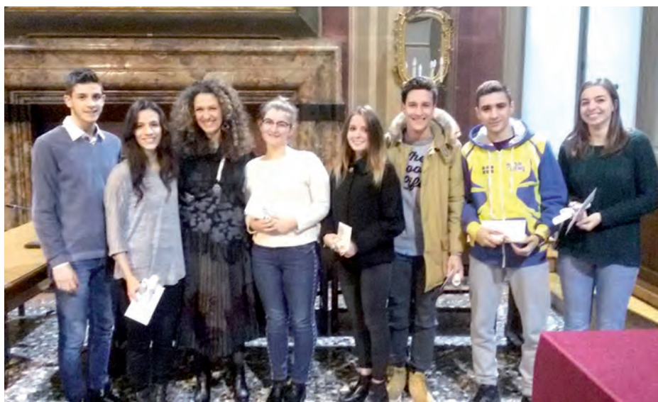
L'assegnazione delle borse di studio agli studenti delle scuole superiori di secondo grado, in sala consiliare

Sempre la scuola al centro, dunque: oltre alle letture spettacolo per la Giornata della Memoria, e all'alzabandiera per la il Giorno del Ricordo, va segnalata la premiazione degli studenti delle superiori che hanno ricevuto le borse di studio comunali, quest'anno incrementate al numero di 15. A loro, e al loro proficuo impegno, la nostra fiducia e gratitudine. Un lungo lavoro di squadra ha quindi consentito di farcire il ricchissimo programma di iniziative per l'intitolazione dell'Istituto Comprensivo a Rita Levi-Montalcini, con attività di ricerca e mostre didattiche, visite a laboratori di ricerca, conferenze di ricercatrici, il