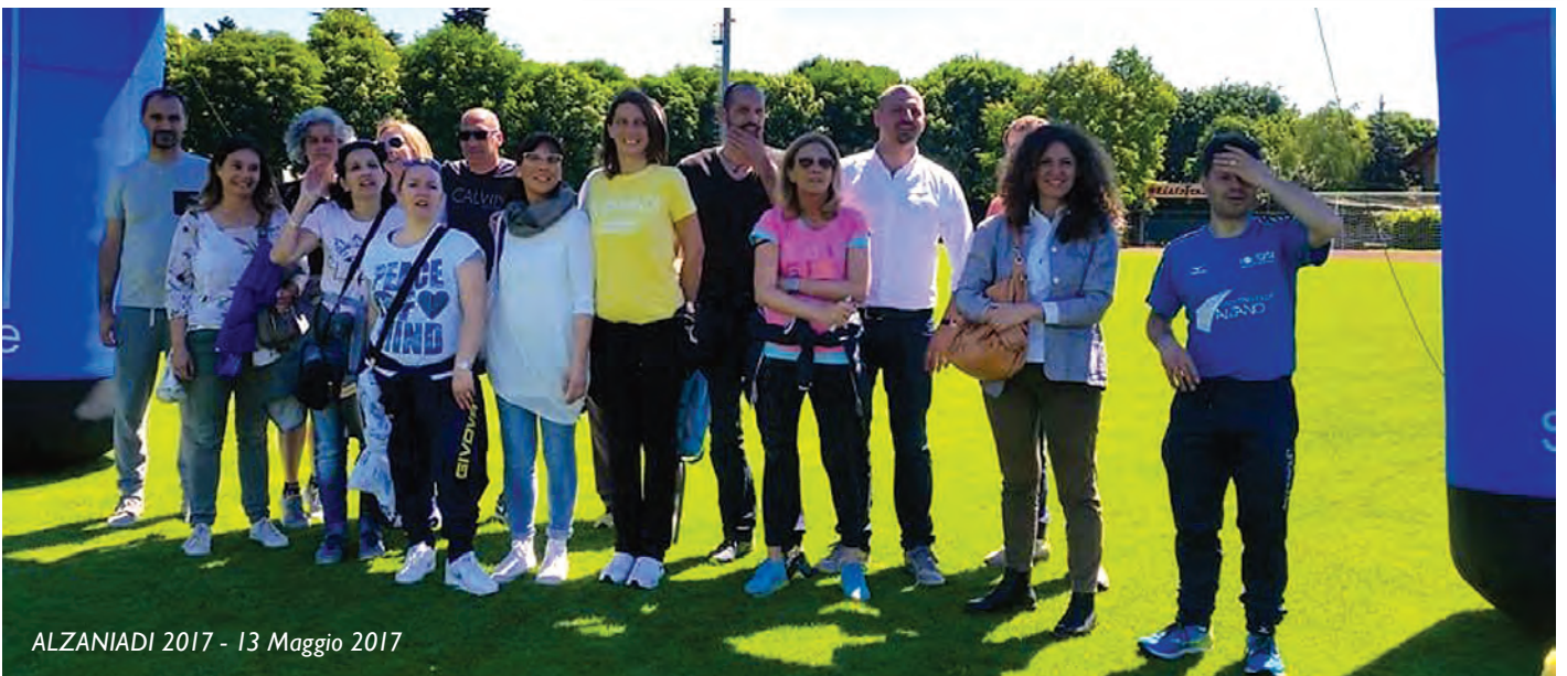
ALZANIADI 2017 - 13 Maggio 2017